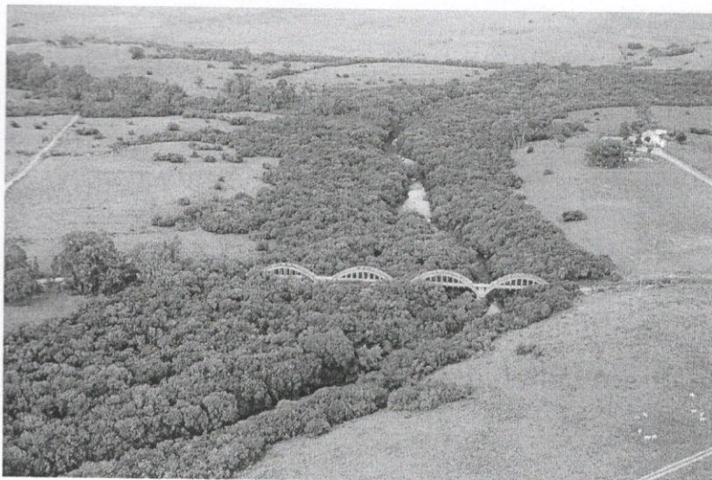
Ponte Mauá.

Declarada patrimônio histórico, artístico e cultural de Arroio Grande pela Lei Municipal nº 2.562, de 19 de abril de 2011, a Ponte Mauá constitui importante engenharia arquitetônica e um dos principais cartões postais de nosso Município. Outrora, teve grande importância na ligação ferroviária entre o Estado do Rio Grande do Sul e a República Oriental do Uruguai. Inaugurada em 23 de maio de 1932, a ponte, junto ao ramal ferroviário ao qual estava integrada, esteve em atividade por cerca de setenta anos.